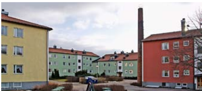
Hyreshusen i kvarteret Bågen är grupperade runt skyddade gårdar.