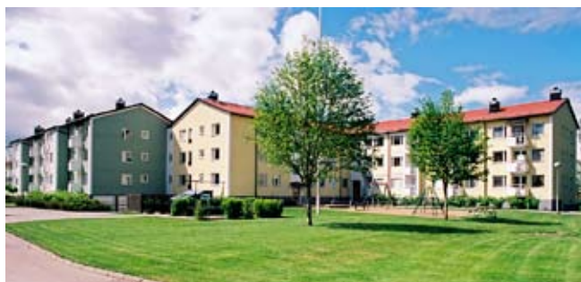
Kvarteret Bågen i Gällkvistområdet är med sina olika fasadkulörer på vinkelbyggda hus kring gårdar ett bra exempel på hur områden med flerbamiljshus planerades under 1950-talet.

Arkitekturen präglades under 1950-talet i än högre grad än tidigare av variation och livfullhet vad gäller färg, form och material. Tegel och puts kombinerades ofta, såväl på olika byggnader inom ett område som på de enskilda byggnaderna. De putsade fasaderna fick ofta en mustigare kulör än under 40-talet. Tack vare att byggandet ännu var relativt småskaligt