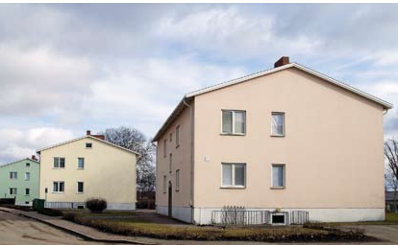
Vid Svennegatan ligger välbevarade flerbostadshus från 1940-talets senare del.

som fortfarande var rådande, ledde vanligen till enkla rutnätsplaner med raka gator. Villaarkitekturen blev på många sätt en mer folklig riktning av 30-talets funktionalism och präglades av enkelhet. De putsade fasaderna levde kvar men stående locklistpanel blev också vanlig som fasadbeklädnad, gärna målad i dämpade pastellfärger. Små enplansvillor om tre rum och kök med källare blev mycket vanliga. Sadeltaken var tegeltäckta och planformen blev mer rektangulär än 1930-talets "funkislådor". Traditionen att bygga villor för två hushåll, där ägaren hyrde ut en av bostäderna, levde kvar och fick sitt uttryck i villor i 1 ½ våning med förhöjt fasadliv och brantare taklutning. Resurserna var fortfarande knappa efter krigsåren, så i trädgårdarna anlades köksträdgårdar och planterades fruktträd och bärbuskar.