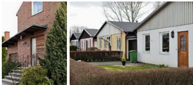
Spejaregatans villor från omkring 1960 har behållit mycket av sin karaktär (överst). Spejaregatan 12 med spännande gestaltning (underst vänster). Kedjehusen från 60-talets mitt finns i kvarteret Dustaren (underst höger).