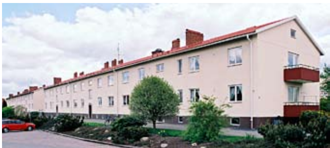
I kvarteret Kronofogden finns flera exempel på flerfamiljshus från 1940-talet.

Knappegatan, som passerar ett småhusområden från 1940-talets mitt, och gå över bäcken Afsen för en liten avstickare in i området Kämpagården.