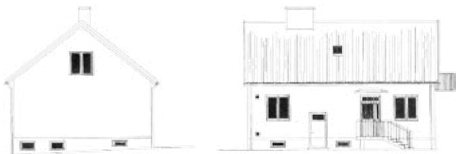
Kvarteren Våpnaren och Vapnet i området Kämpagården bebyggs redan under krigsåren med småhus. Ritning till enfamiljshus i korsningen Myntusgatan – Riddaregatan, upprättad 1943 av arkitekt Mogens Mogensen, Helsingborg.

som fortfarande var rådande, ledde vanligen till enkla rutnätsplaner med raka gator. Villaarkitekturen blev på många sätt en mer folklig riktning av 30-talets funktionalism och präglades av enkelhet. De putsade fasaderna levde kvar men stående locklistpanel blev också vanlig som fasadbeklädnad, gärna målad i dämpade pastellfärger. Små enplansvillor om tre rum och kök med källare blev mycket vanliga. Sadeltaken var tegeltäckta och planformen blev mer rektangulär än 1930-talets "funkislådor". Traditionen att bygga villor för två hushåll, där ägaren hyrde ut en av bostäderna, levde kvar och fick sitt uttryck i villor i 1 ½ våning med förhöjt fasadliv och brantare taklutning. Resurserna var fortfarande knappa efter krigsåren, så i trädgårdarna anlades köksträdgårdar och planterades fruktträd och bärbuskar.