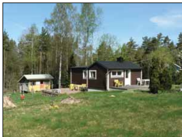
Exempel på fritidshus i området.