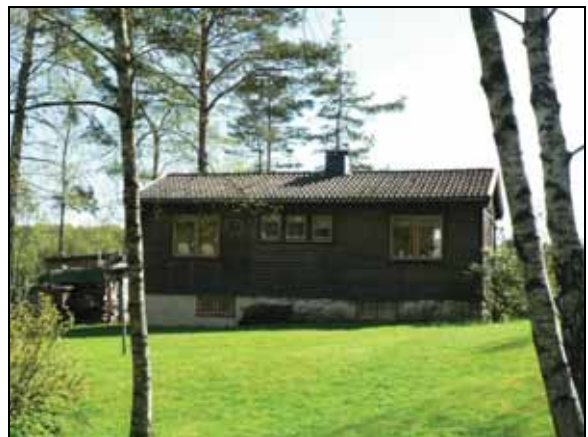
Exempel på fritidshus i området.