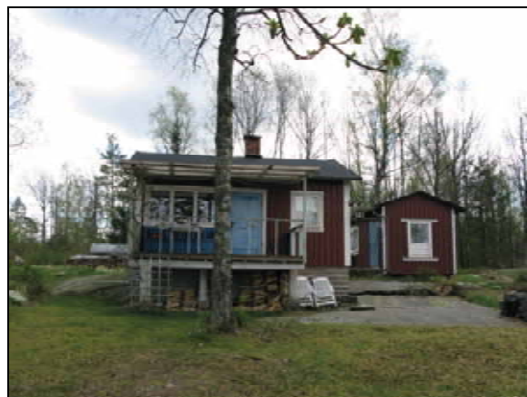
Exempel på fritidshus belägna runt sjöarna.