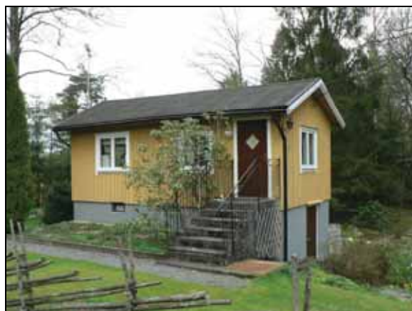
Exempel på fritidshus i området.