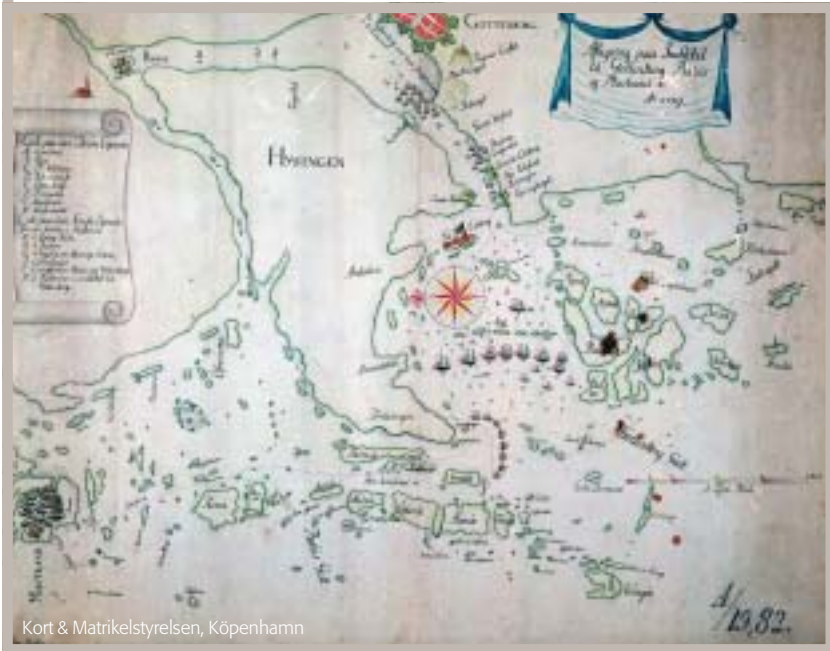
Kort & Matrikelstyrelsen, Köpenhamn

Under vattnet utgör skeppsvraken den i särklass vanligaste fornlämningstypen. Vrak påträffas i alla marina miljöer men förekommer oftast vid väderkänsliga grundområden och farliga passager i ytterskärgården. Andra exempel på fornlämningar under vattnet är lämningar efter brygg- och kajanläggningar och kulturlager, vilka ibland kan påträffas i hamnar och utanför äldre bosättningar och industrier. Också i inlandet, på botten av sjöar och vattendrag, finns talrika spår efter mänsklig verksamhet i form av exempelvis fasta fiskredskap, spärranläggningar och utkastlager i anslutning till förhistoriska boplatser.